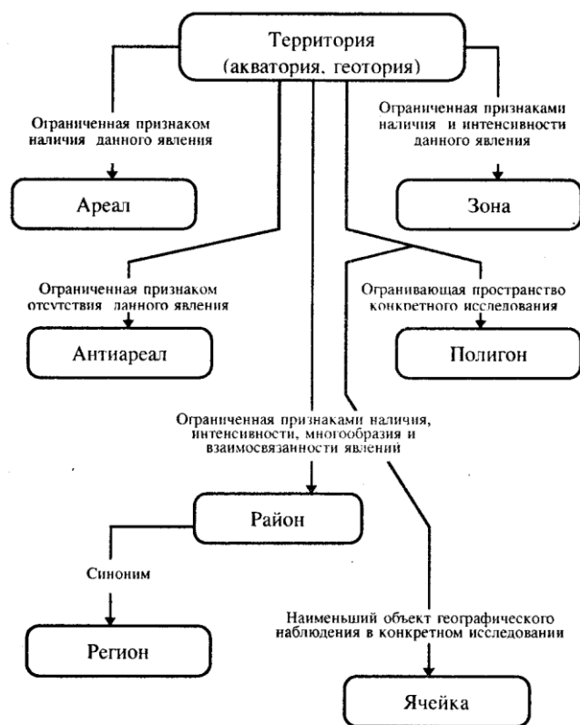
Рис. 32. Единицы пространства (по Э. Б. Алаеву)

Задание 33. Заполните схему «Факторы, принципы, критерии общественно-географического районирования».